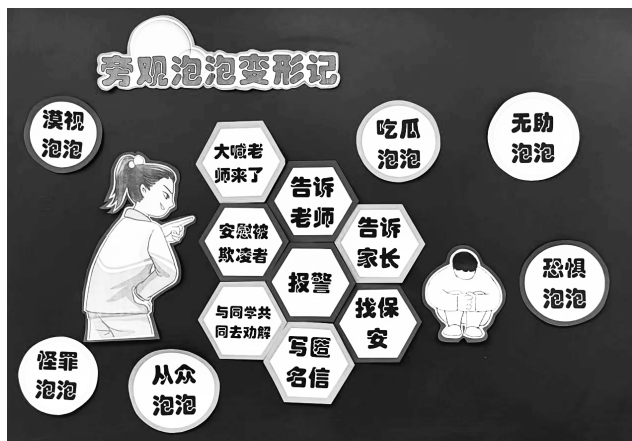
图4 “旁观泡泡变形记”板贴

设计意图： 总结全课，借由建筑师和蜂巢的比喻让学生感受到旁观者们团结起来的勇气和力量，引导学生将课堂上生成的助人行动运用到现实生活中。