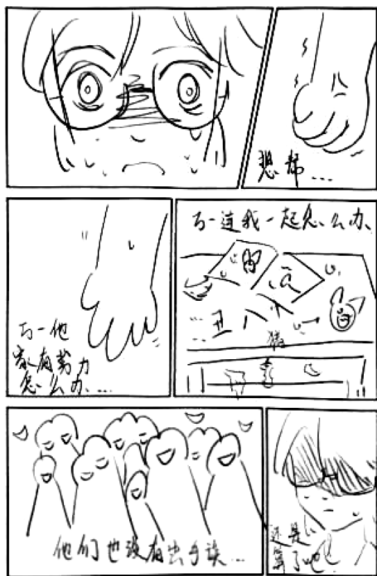
图2 学生漫画作品二