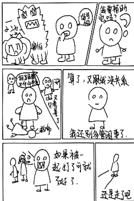
图3 学生漫画作品三

生5：我觉得有的旁观者虽然内心想帮，但又害怕被打，而且其他旁观者也都没有出手帮助，想想自己也算了吧（见图3）。