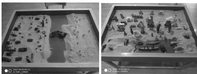
图5 ADHD儿童的沙盘作品（中期）

整个沙盘游戏将经历三个阶段：问题呈现阶段、抗争及积极重构阶段、综合转化阶段。中期（见图5），战争主题的正面方不断扩大，水的面积越来越大，表明儿童趋于正面与冷静；人与动物主题则逐步变得有秩序，水的面积增大，动物更趋向于悠然状态，表明儿童的秩序感增强，情绪趋于稳定。在此过程中，心理教师致力于为儿童营造一个“自由与受保护”的空间，他们在沙盘游戏过程中不断释放和调配着心理能量。