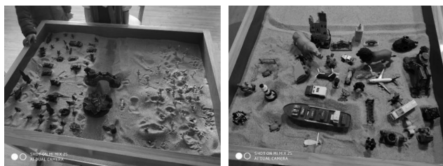
图4 ADHD儿童的沙盘作品（前期）

ADHD儿童在沙盘游戏初期多使用动物、交通工具、军事工具等能量强大的沙具类型，主题多呈现战争等场景，在沙盘游戏过程中常有沙具移动频繁、沙盘较满和占据空间等特点。（见图4）